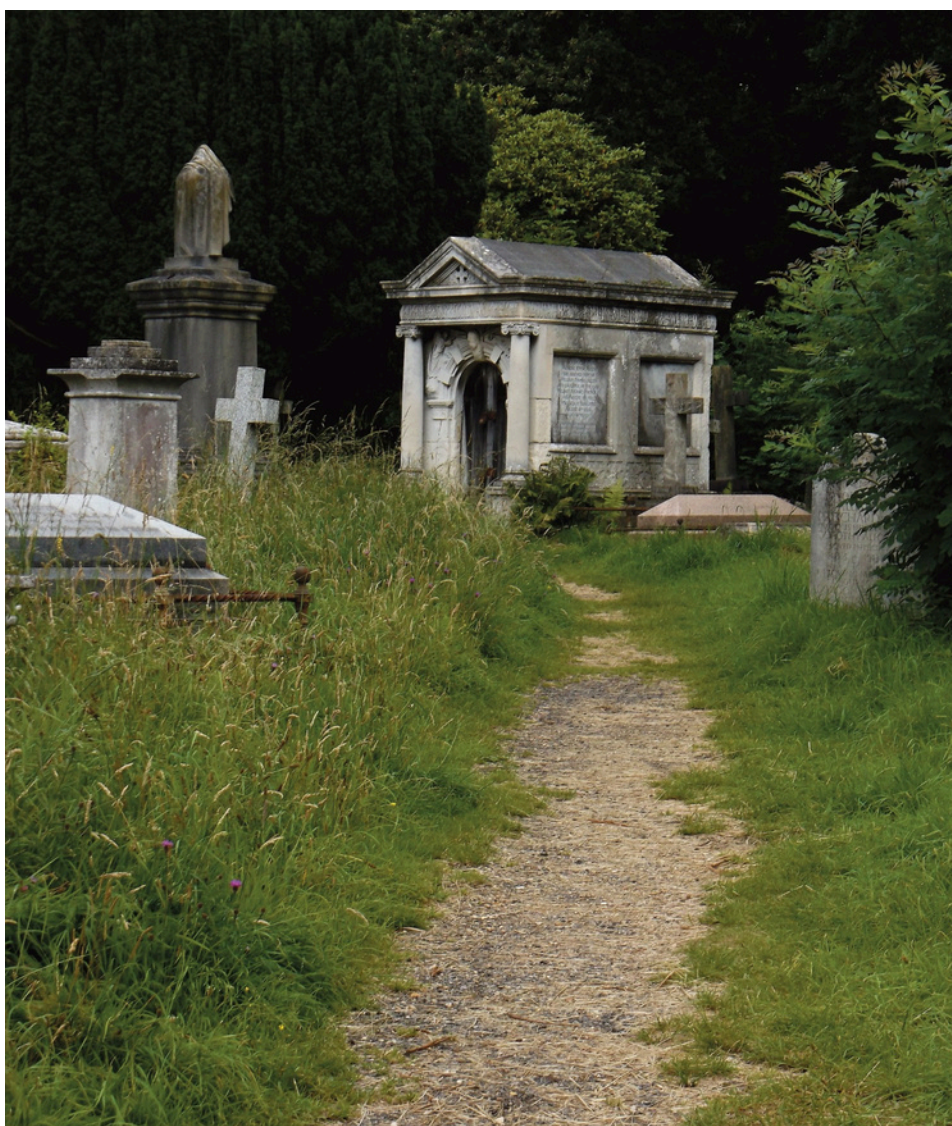
Los finlandeses acuden al cementerio la tarde de Noche Buena y encienden velas junto a las tumbas de sus seres queridos.

deben remover la masa tres veces, pudiendo ver el fondo del cazo en cada vuelta, y pedir un deseo que hay que mantener en secreto hasta que se cumpla. Si una chica soltera no participa, puede olvidarse de encontrar marido ese año. En el pudín se echa una moneda de plata, un dedal y un anillo. Encontrar la moneda es señal de buena suerte; el dedal, de prosperidad, y el anillo anuncia boda en la familia (puede