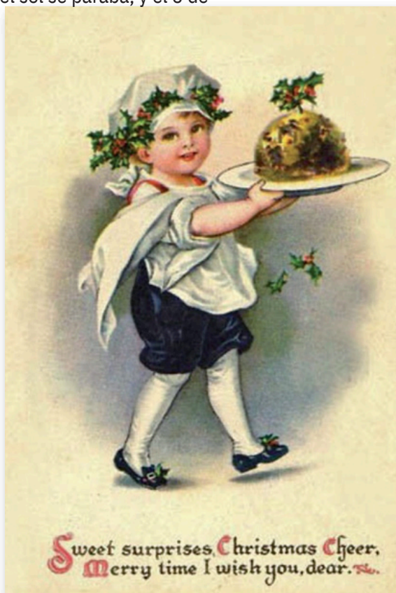
Tarjeta navideña del siglo XIX, con el tradicional Christmas pudding.

Si hay pastel de Navidad (el Christmas pudding inglés) es obligado que todos participen en su elaboración para la prosperidad del hogar. Cada miembro de la familia (incluidos los bebés, con ayuda de los padres)